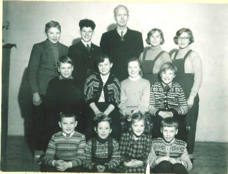
Klassebilde Sunddalen skule, Hol kommune